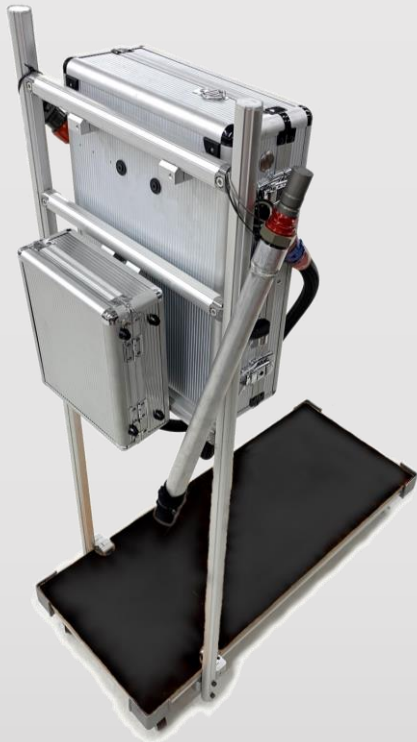
※リフューエリングキット(標準タイプ)

F111/3専用の携帯式給油装置です。12Vバッテリー電源を搭載しており場所を問わずに給油する事が出来ます。スタンドに重量計を乗せて運用する事を想定しております。バッテリーケースは単体で持ち運び出来るので、ジャンプスタート時に使用する事も可能です。異物の侵入を未然に防ぐ事が出来ますので、フィルターオプションの設定をお勧めします。 ■主要サイズ：450(W) x 930(D) x 1,275 (H) ■スタンドサイズ：390(W) x 710(D)