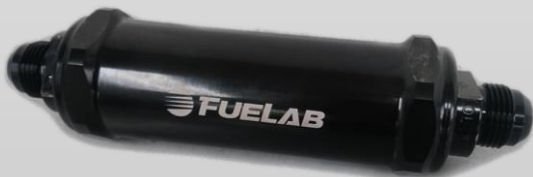
※プレフィルターオプション